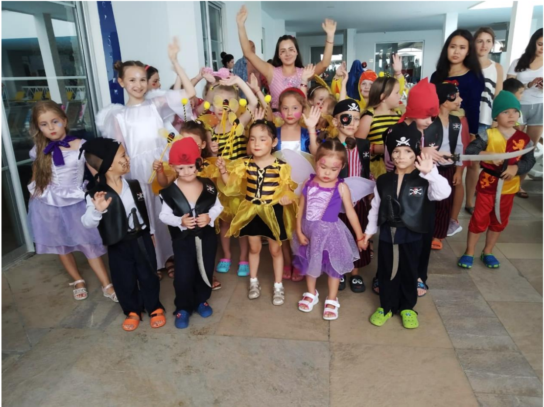
Додаток 3. Дитяча анімація. Дитячий карнавал.