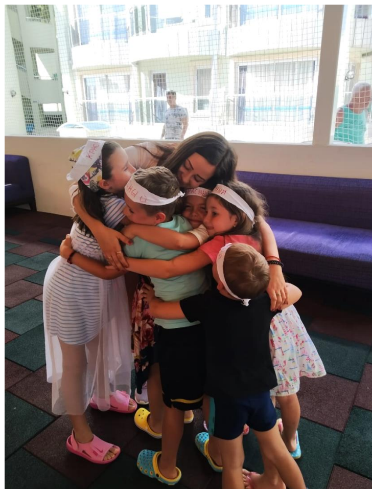
Додаток 8. Дитяча анімація.