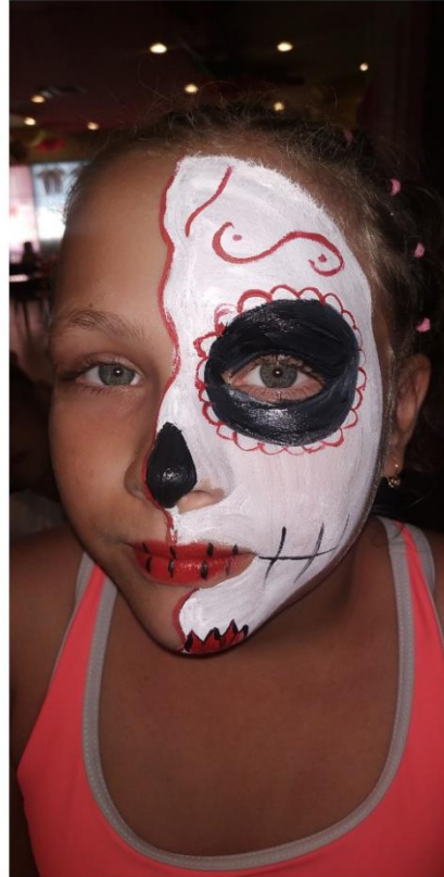
Додаток 4. Дитяча анімація. Face painting.