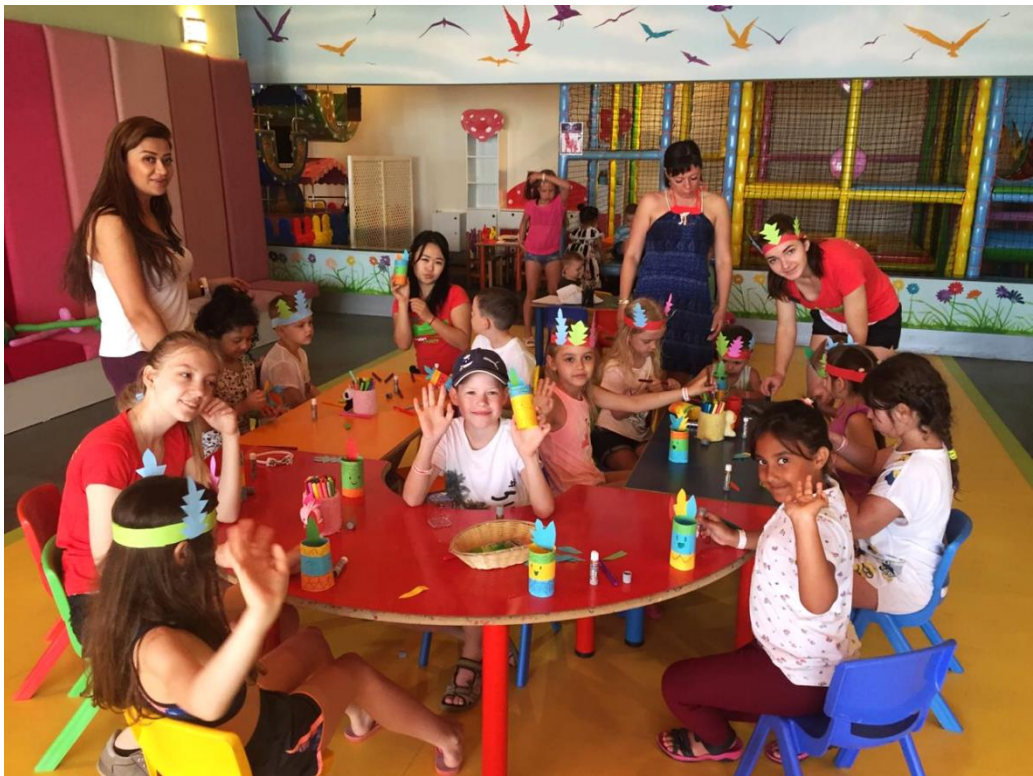
Додаток 5. Дитяча анімація. Рукоділля.