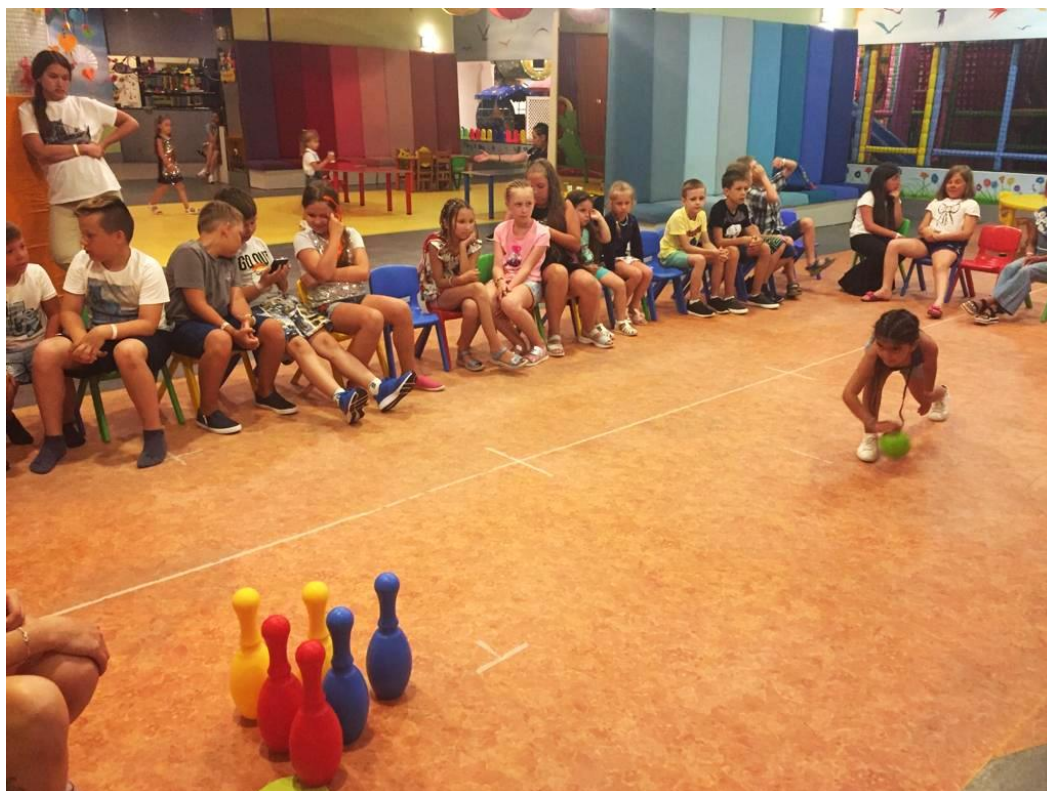
Додаток 7. Дитяча анімація. Гра “Боулінг”