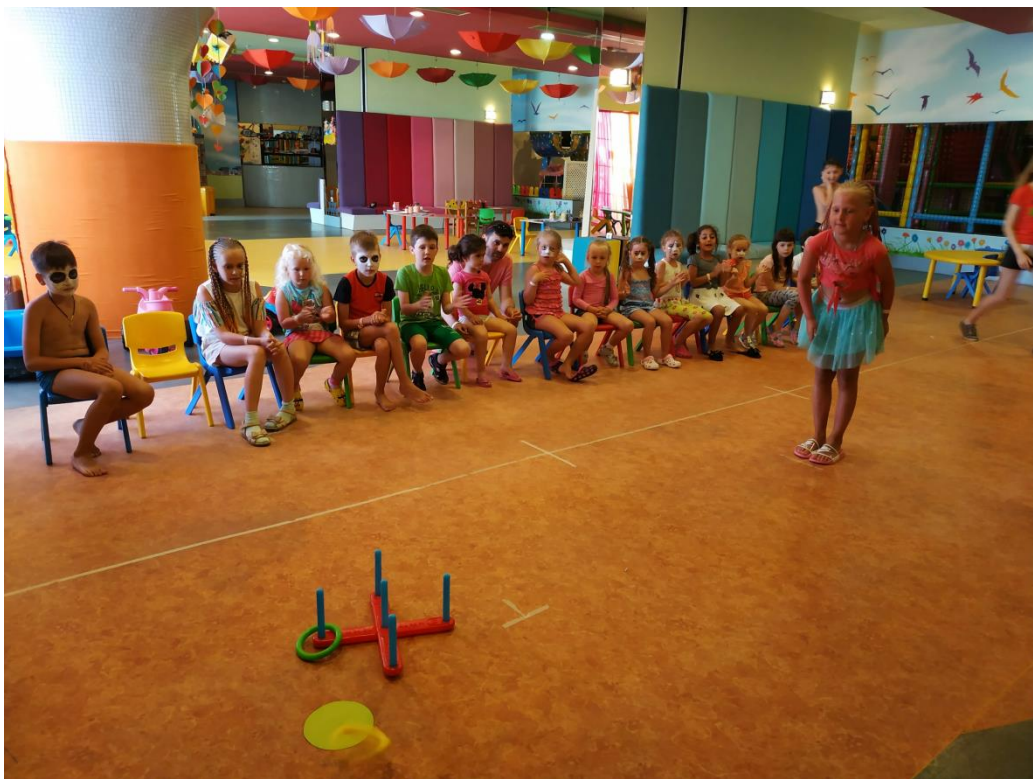
Додаток 6. Дитяча анімація. Гра "Рінго"