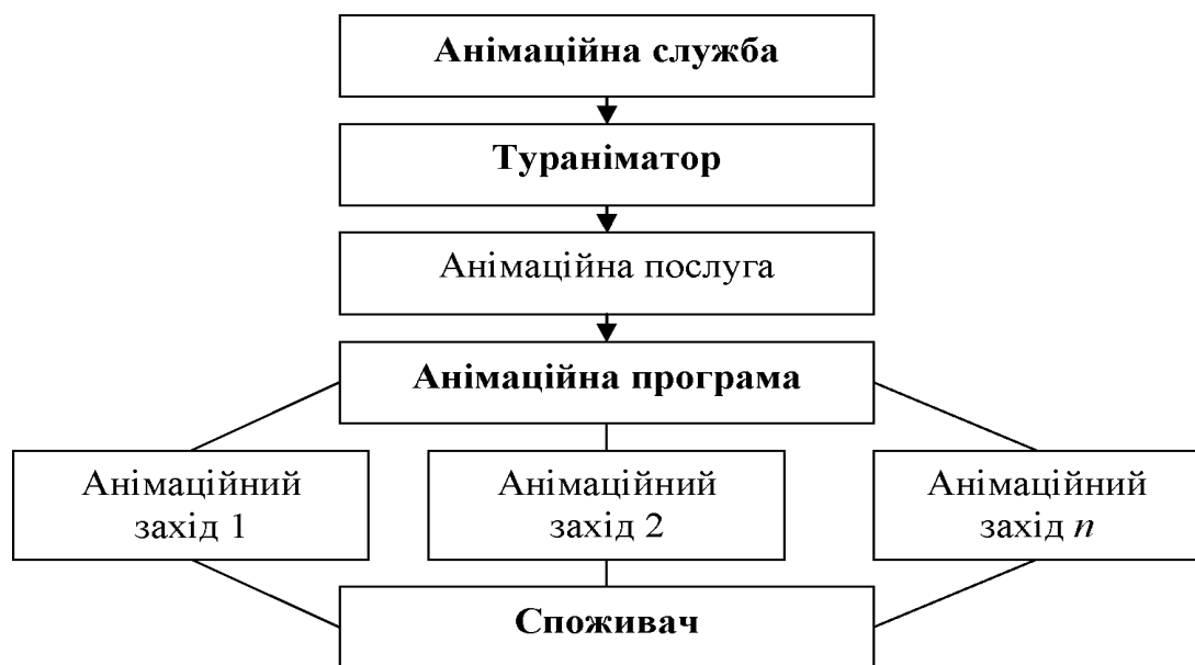
Рис.1.2. Складники готельної анімаційної діяльності

Проект-це обмежена за часом цілеспрямована зміна окремої системи з встановленими вимогами до якості результатів, можливими рамками витрати коштів і ресурсів[32, с. 415].