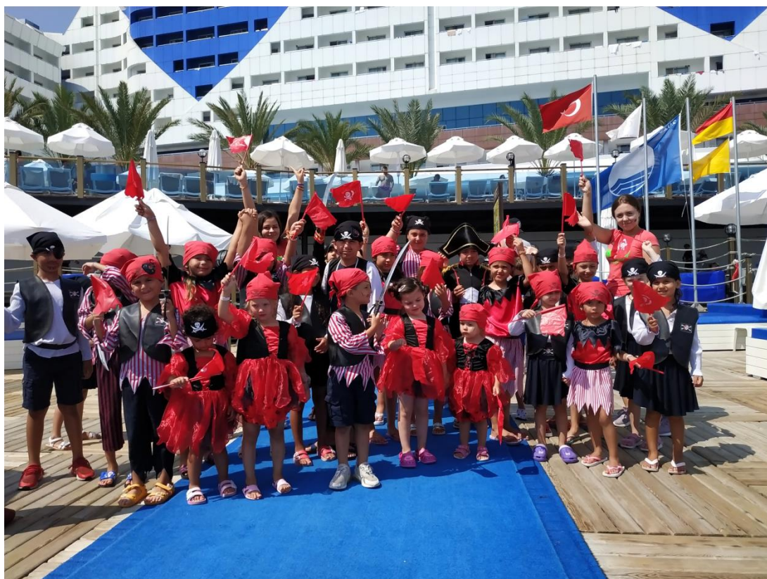
Додаток 2. Дитяча анімація. День піратів.